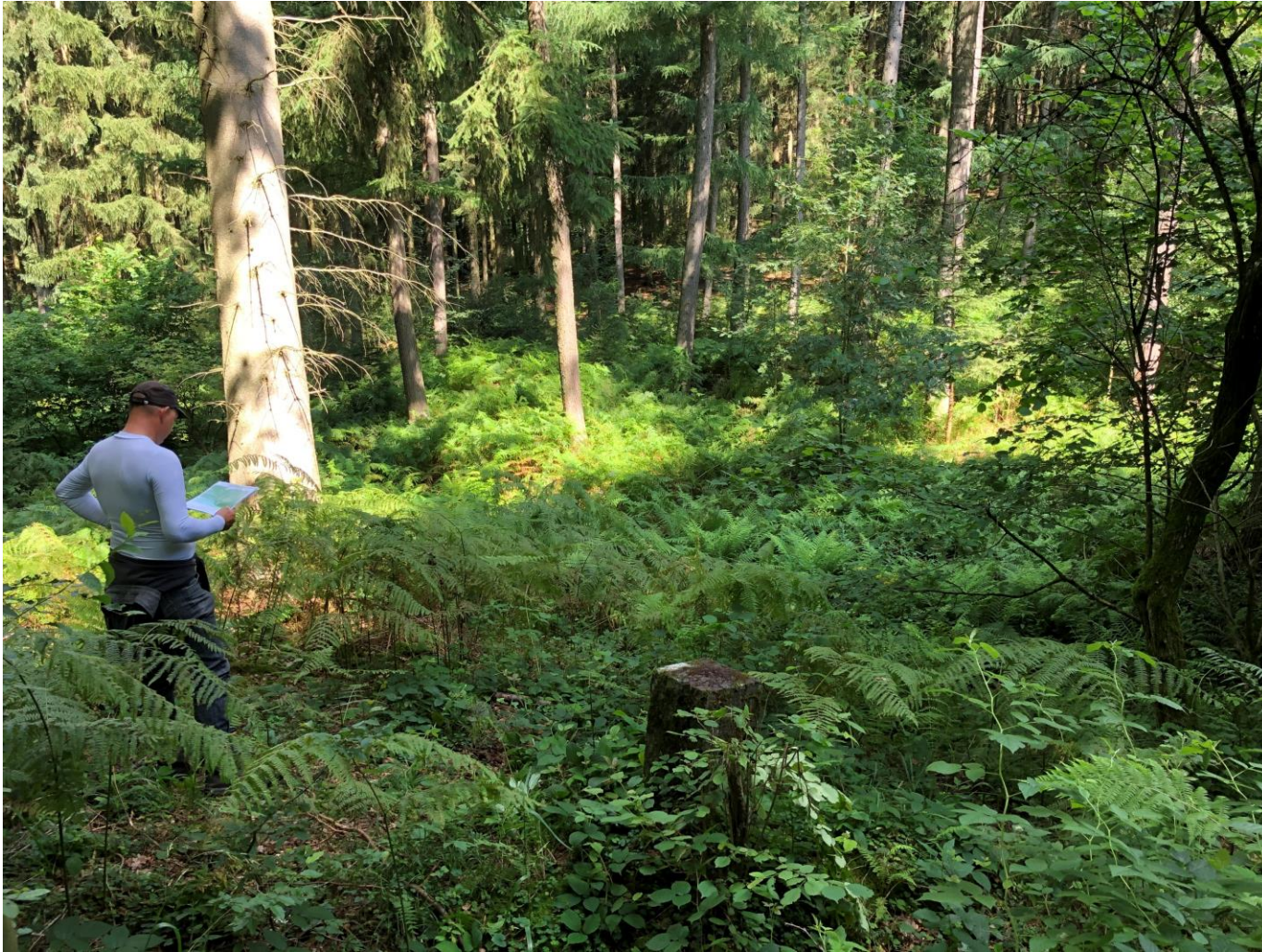
Het was pittig zoeken in het groen