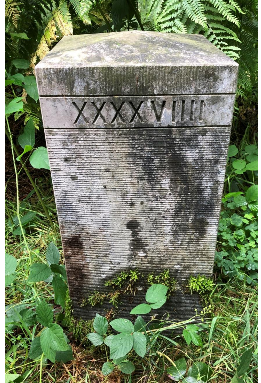
Een nieuwe steen