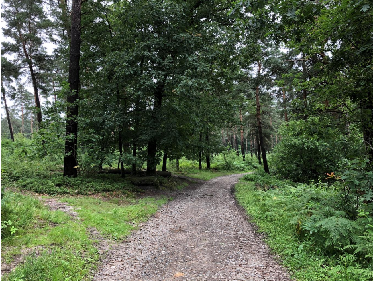
L niet kunnen vinden