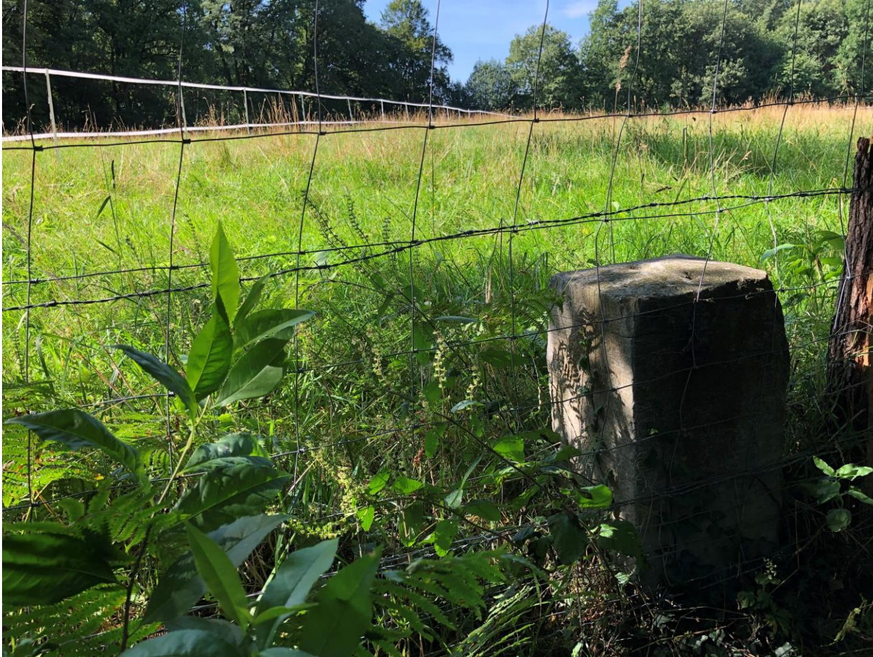
Staat langs een weiland