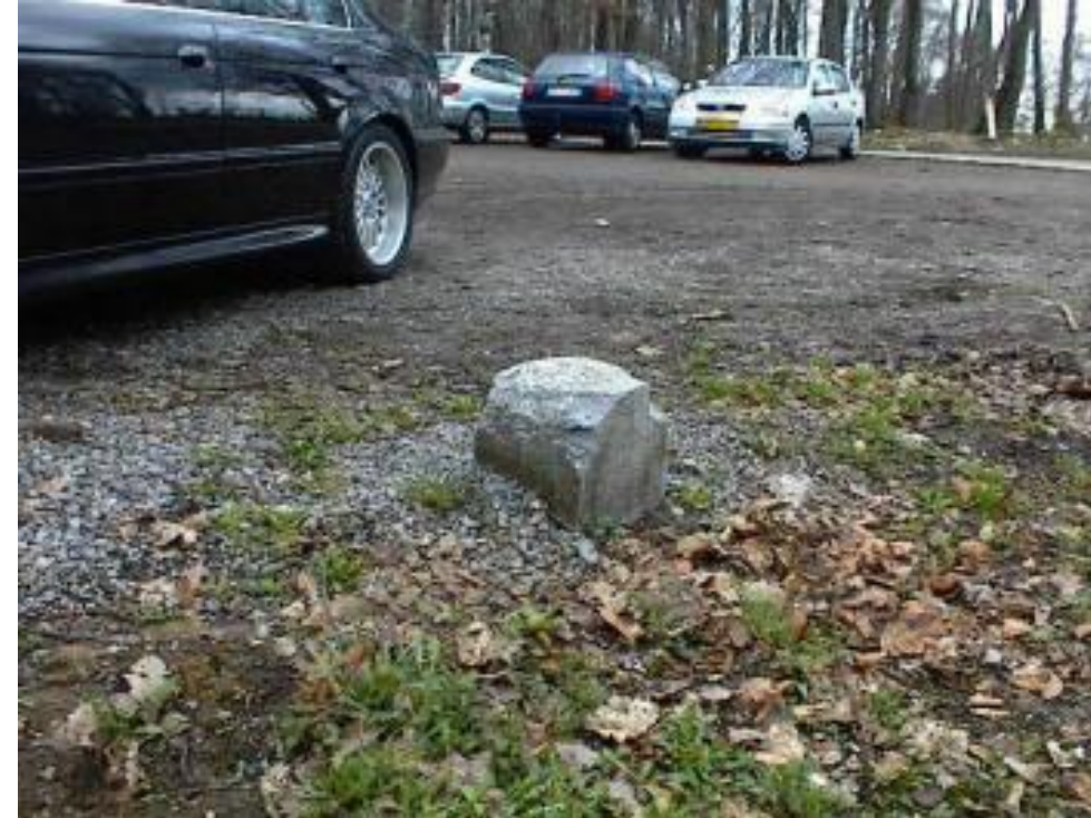
Verdwenen bij uitbreiding / asfaltering parkeerterrein (B) bij DLP. Foto rechts: Peter Dirven, 2004