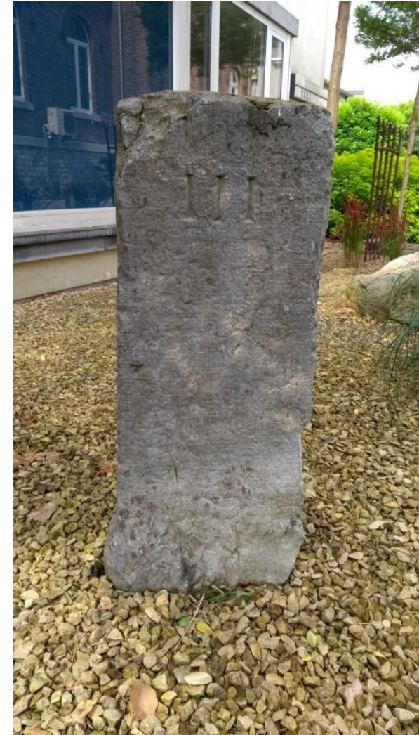
Binnenplaats gemeentehuis; foto's Boudewijn Palthe, 3 aug 2021